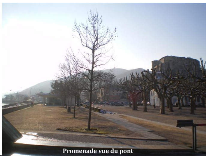
Promenade vue du pont