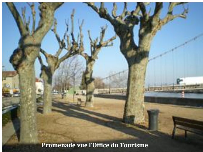
Promenade vue l'Office du Tourisme

Sous cette promenade se cache l'emplacement de l'ancien quai du Rhône; le lieu concentre ainsi l'intérêt des habitants à admirer le fleuve qui les borde, et les évolutions du paysage et de l'histoire de la ville.