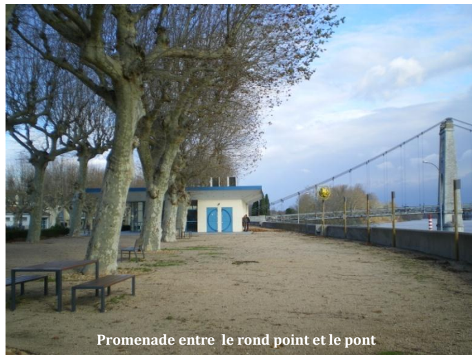
Promenade entre le rond point et le pont