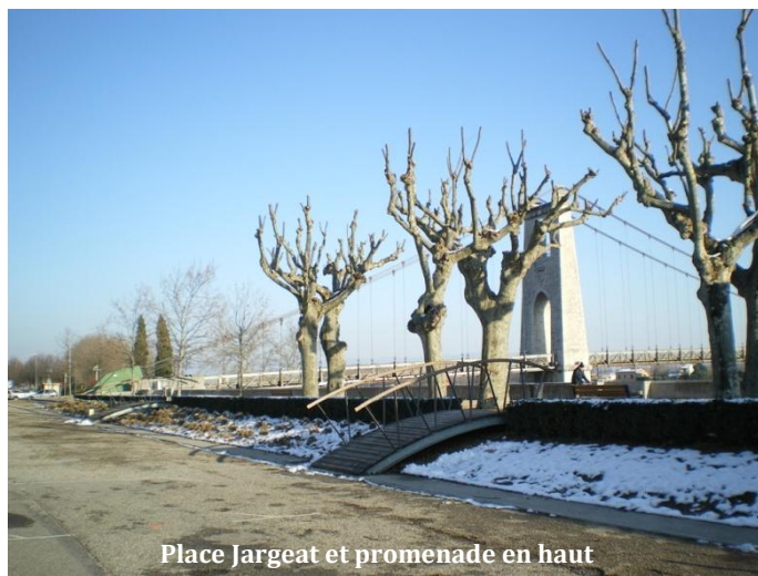
Place Jargeat et promenade en haut